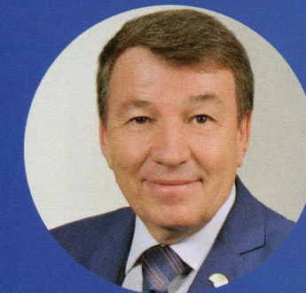
Владимир Соловьёв, министр культуры УР:

– Открытие Национальной библиотеки – это большое событие для всей республики. Я считаю, что получилось очень красиво. Просто классно! Когда два года назад началась реконструкция библиотеки, я часто приходил сюда, смотрел, как идут работы. Мне очень понравилось, как преобразилась Национальная библиотека. В обновлённом здании всё продумано до мелочей, удобно и современно. Но главное – сохранился академический дух, который всегда присутствовал здесь. Нужно отметить, что эта библиотека является настоящим культурным и методическим центром, и её сотрудники охотно делятся своим богатым опытом работы с коллегами из городов и районов республики.