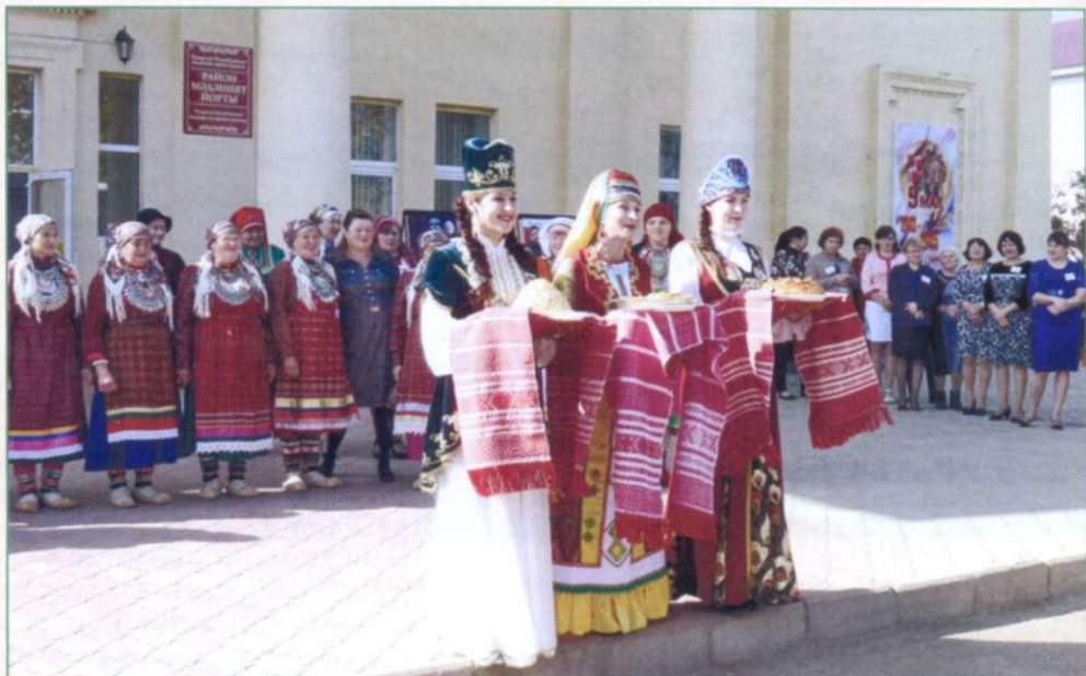
Встреча участников конференции в поселке Кукмор Республики Татарстан